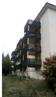
Valentigney « La Novie »