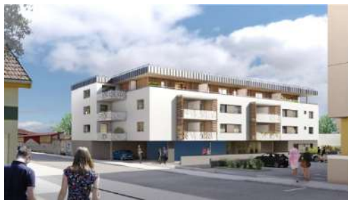
Pontarlier « Saint-Pierre » (perspective)