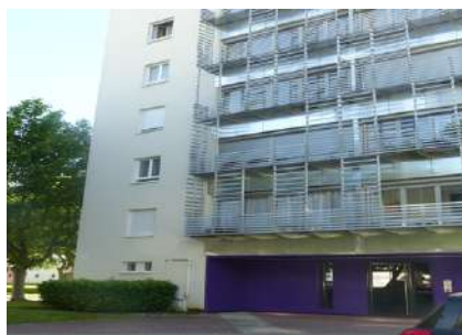
Sochaux, 6 rue des Graviers