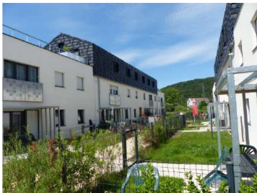
Voujeaucourt « Les Jardins du Moulin »

Ainsi, au 31 décembre 2019, le patrimoine géré est de 3 068 logements, 1 256 garages et parkings sur 26 communes.